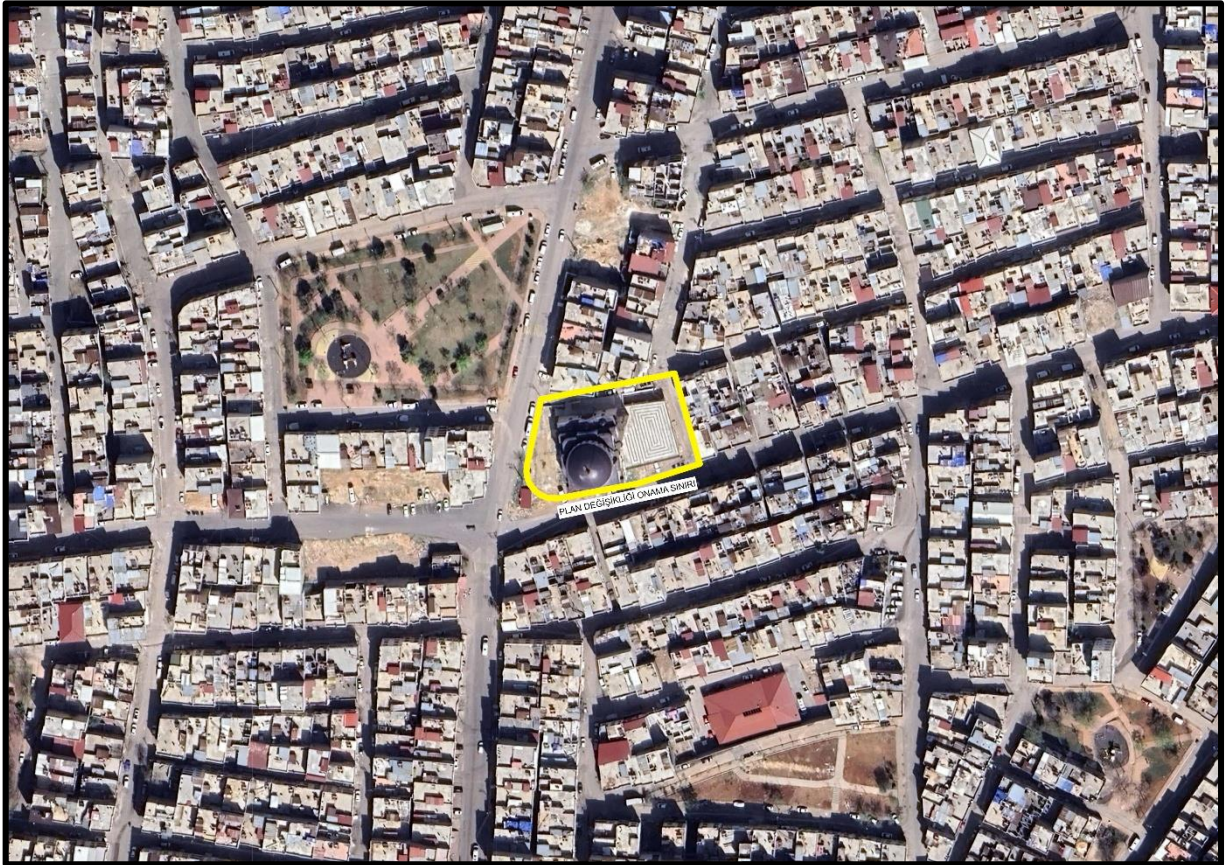
Şekil 1: Proje Alanı Kent İçerisindeki Konumu

1/1000 ölçekli uygulama imar planı değişikliğine konu, ada 3045 parsel 3'te kayıtlı taşınmaza isabet eden alan, Gaziantep Kent Bütünü uygulama imar planı içerisinde bulunmaktadır. Söz konusu alan mevcut 1/1000 ölçekli uygulama imar planında Cami Alanına isabet etmektedir.