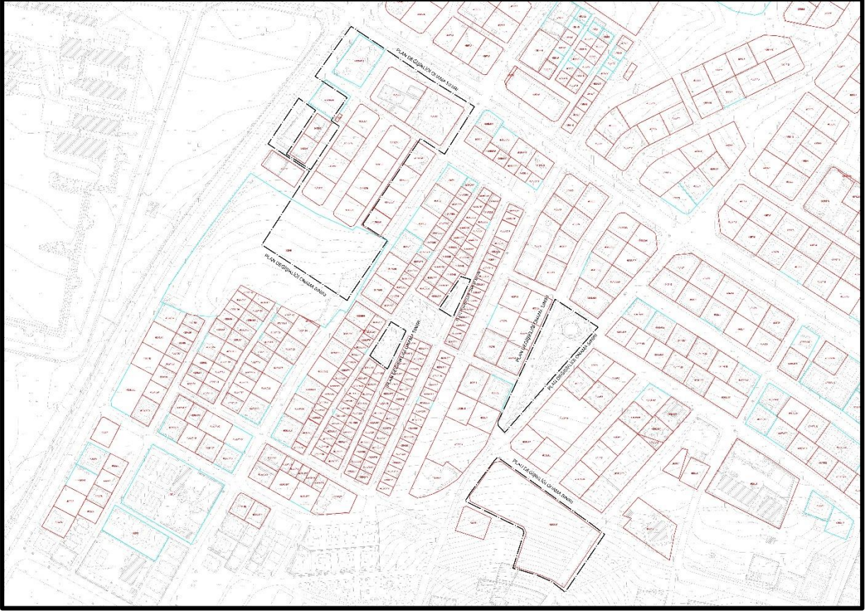
Şekil 3: Güneykent Mahallesi Proje Alanı Mevcut 1/1000 Ölçekli Uygulama İmar Planı