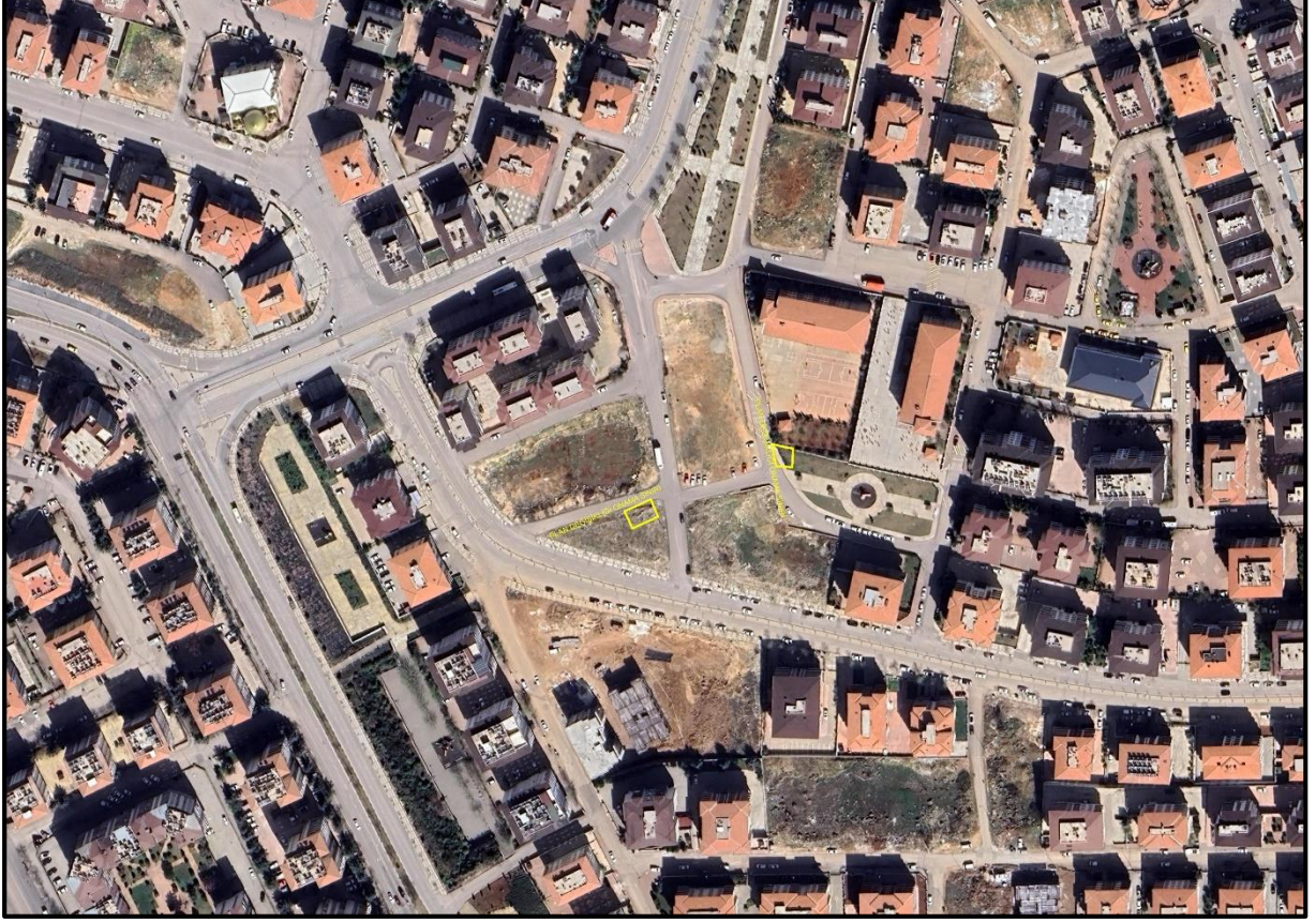
Şekil 1: Proje Alanı Kent İçerisindeki Konumu

1/1.000 ölçekli uygulama imar planı değişikliğine konu alanlar Şahinbey İlçesi, Bülbülzade Mahallesi sınırları içerisinde, 136033 ve 136034 nolu sokaklar üzerinde yer almaktadır.