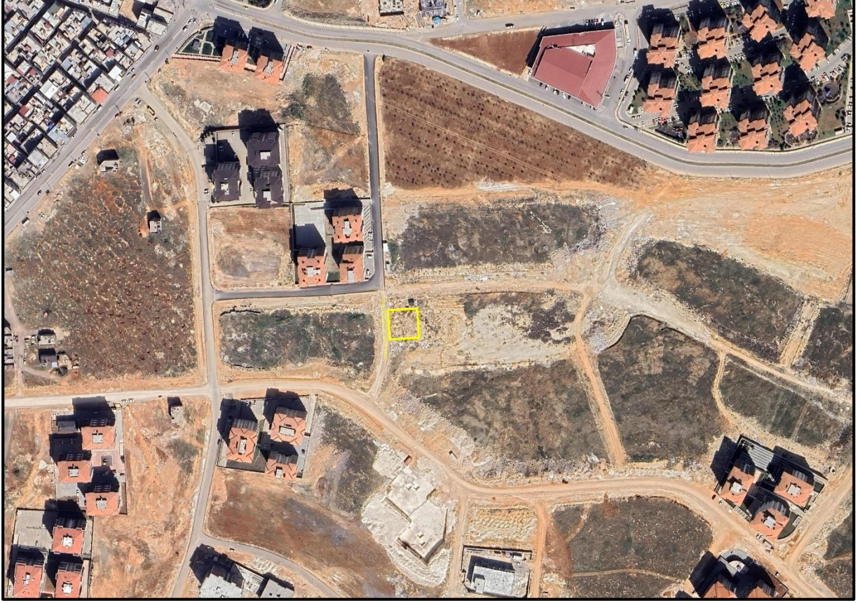
Şekil 1: Proje Alanı Kent İçerisindeki Konumu

1/1.000 ölçekli uygulama imar planı değişikliğine konu alan Şahinbey İlçesi, Geylani Mahallesi sınırları içerisinde, 188026 nolu sokak üzerinde yer almaktadır.