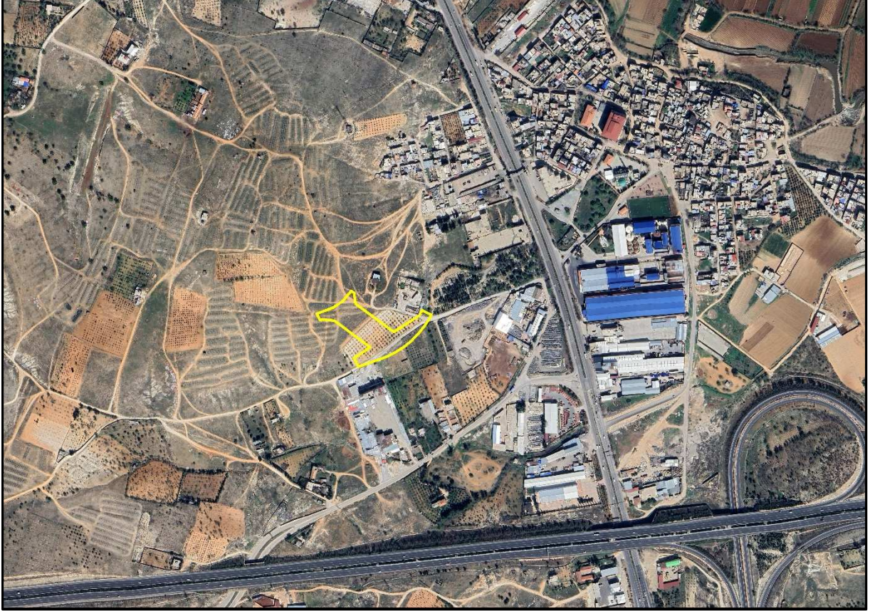
Şekil 1: Proje Alanı Kent İçerisindeki Konumu

1/1.000 ölçekli uygulama imar planı değişikliğine konu alan Şahinbey İlçesi, İbn-i Sina Mahallesi sınırları içerisinde, Havaalanı Yolu Bulvarı üzerinde yer almaktadır.