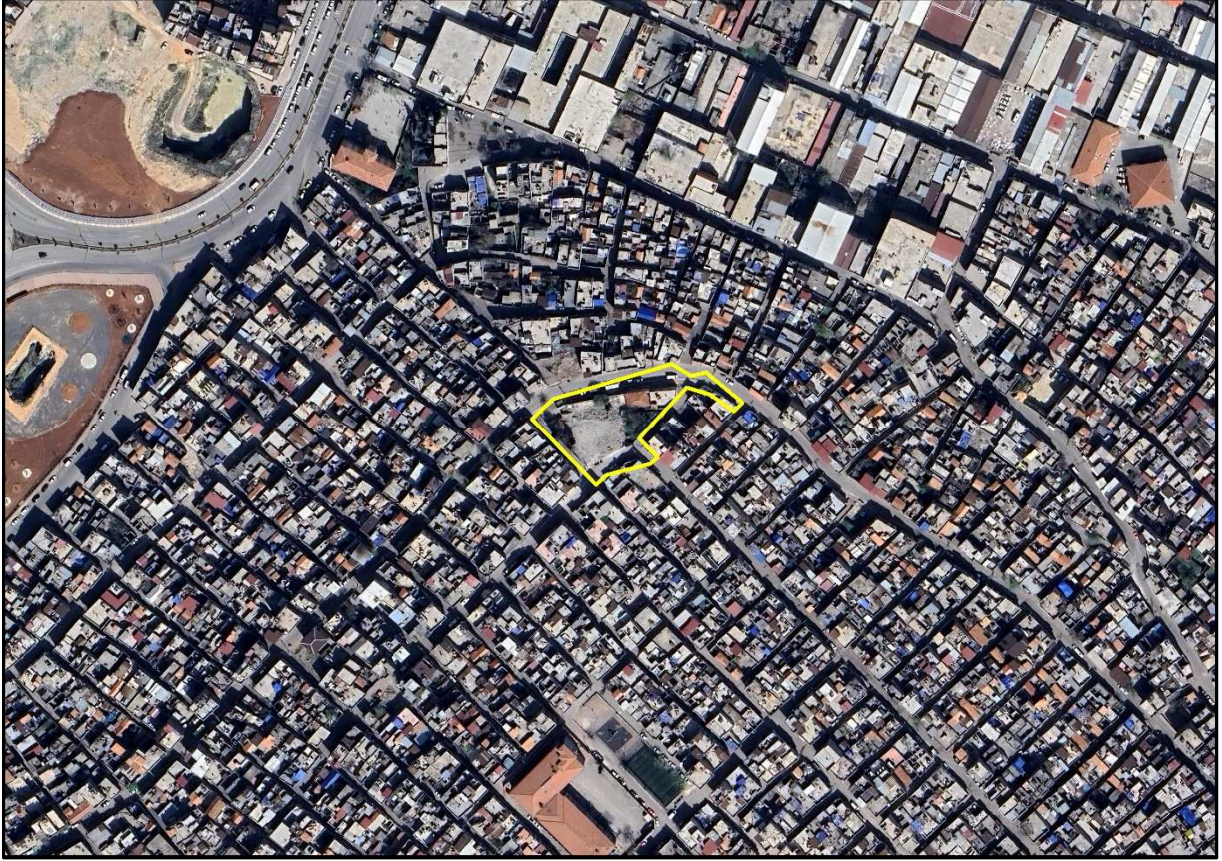
Şekil 1: Proje Alanı Kent İçerisindeki Konumu

1/1.000 ölçekli uygulama imar planı değişikliğine konu alan Şahinbey İlçesi, Ünalı Mahallesi sınırları içerisinde, Karayılan caddesi ve Tefik Özocaklı sokak üzerinde yer almaktadır.